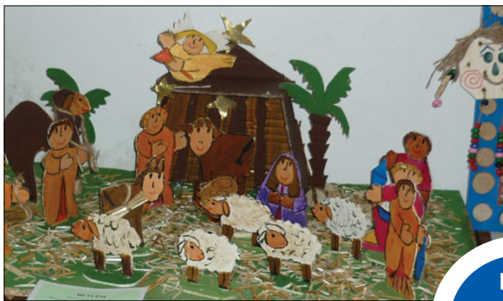
Betlém z recyklovaného odpadu