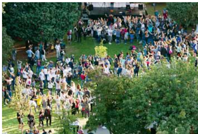
Pokořený rekord v počtu tanečníků na jednom místě ve tvaru dvojky