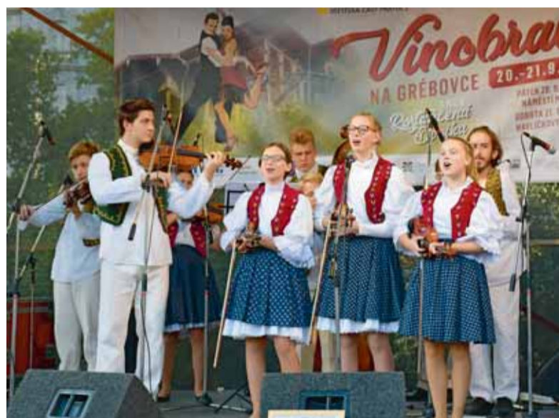
Lidový soubor Kolíček, ZUŠ Ilji Hurníka na náměstí Míru