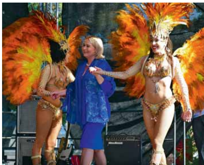
Letošní vinobraní mělo podtitul Roztančená dvojka