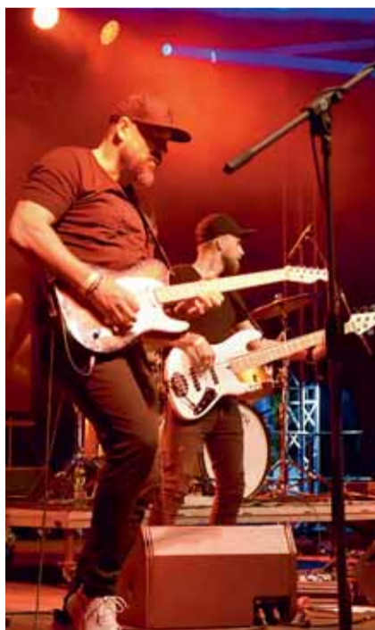
Support Lesbiens byli hvězdou programu