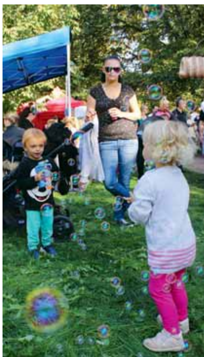
Dolní část Grébovky patřila dětem