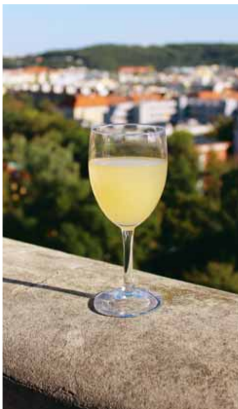
Burčák nad vinicí Grébovka