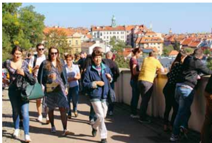
Sobotní Grébovka ve znamení pohody a relaxování