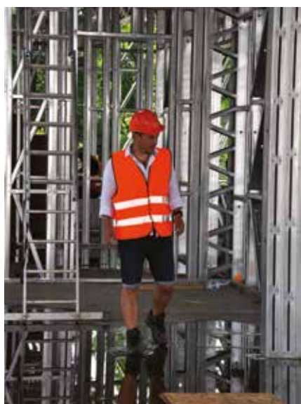
Smutné, opuštěné Pitkovice.

Děkuji všem za podporu a přeji vám a vašim dětem nadějně září 2022.