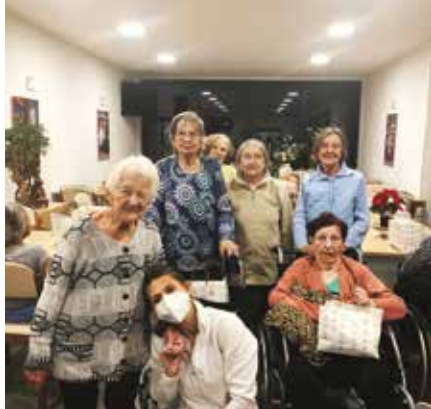
Z vánoční nadílky v ALZHEIMER HOME.