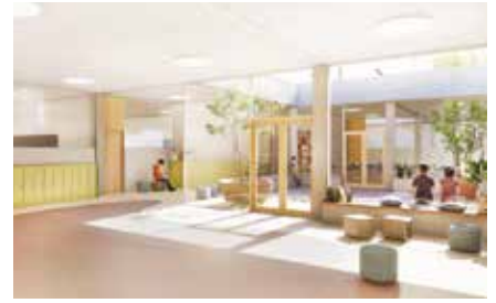
Vizualizace budoucí školy pocházejí z vítězného návrhu re:architekti.

jasné. Nikdo tady s něčím podobným neměl zkušenosti, mnohem menší stavby (DPS Betlímek, podzemní školka, polyfunkční dům Pitkovice...) ukazovaly, jak moc chybí zkušenosti. Byly plné problémů a zpožděly je pozměňované smlouvy a spory, které vedla radnice s okolím.