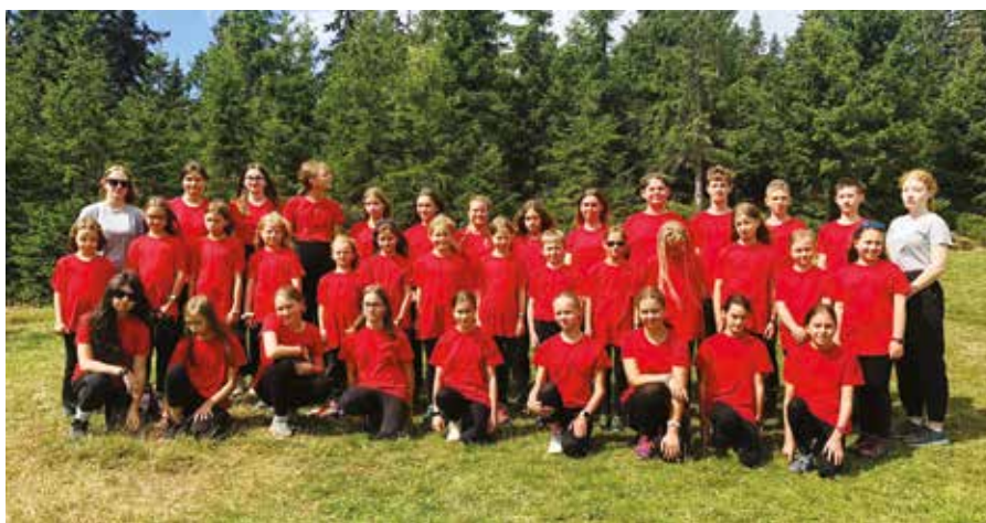
Krkonošské počasí soustředění docela přálo.

Aby ale soustředění nebylo jen o práci, děti zažívají také spoustu zábavy. Kolektiv utužují v týmových soutěžích, kde získávají potřebné body pro