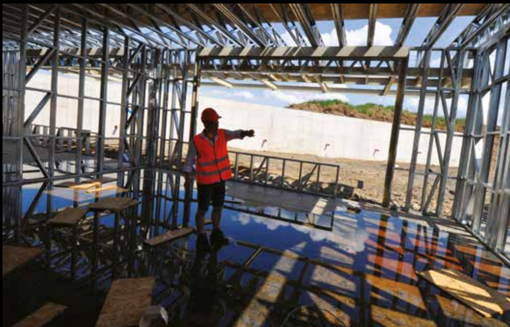
Opuštěná stavba působí depresivně.

V té době ještě veřejnost o ničem nevěděla a bývalá politická reprezentace se holedbala, jak se díky ní v Pitkovicích skvěle staví. Na radnici mezitím začal audit, který měl zjistit, zda samotný výběr firmy neprovázely nějaké nejasnosti. (Dosud to totiž nikoho nenapadlo.)