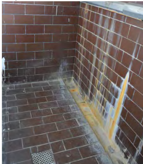
stav před rekonstrukcí

se nachází pod prostory sociálního zázemí v budově. Žumpa byla osazena na pozemku za zpevněnou