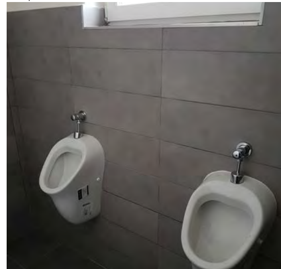
stav po rekonstrukci

asfaltovou plochou hned naproti přístavby sociálního zázemí. Náklady na obě akce činily cca 130.000,- Kč.