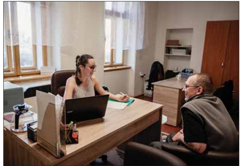
Ilustrační foto z doby před nouzovým stavem

Snadnější vstup pro živnostníky, budou moci vstoupit do oddlužení i bez schválení věřitelů. Oddlužení nebude rušeno ani v případech, kdy dlužník neplní splátkový kalendář v souvislosti s mimořádným opatřením. Zakázané dražby nemovitostí u dlužné jistiny do 100tis. Kč U oddlužení schválených před 1. 6. 2019 se ruší podmínka úhrady alespoň 30 % dluhu.