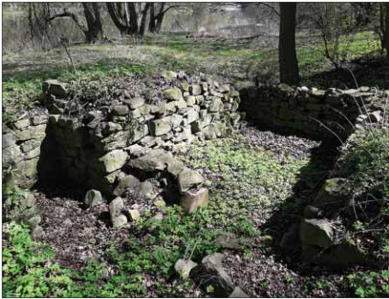
Želinský mlýn čili kaple sv. Marie Magdaleny (jaro 2020)

Pod kostelíkem sv. Vavřince na Želině se u břehu Ohře nalézají dosud patrné zříceniny zvláštního areálu, o němž pověsti vyprávějí, že býval součástí někdejšího kláštera sester magdalenek, který koncem 13. století založil kadaňský purkrabí Albrecht ze Žeberka. Ještě před třiceti lety mi někteří němečtí Kadaňané o jedné z tamějších ruin, kterou vidíte na doprovodné fotografii, tvrdili, že jsou to zbytky klášterní kap-