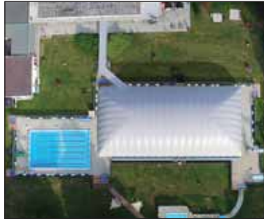
Studie zastřešení kadaňského koupaliště