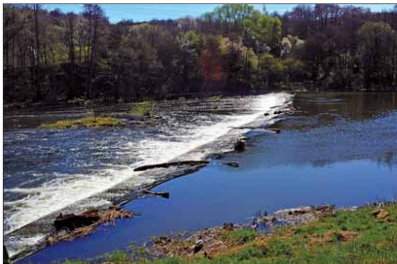
Kadaňský jez pod Střelnici nepřináší momentálně nejlepší pohled. Po zimním období jsou zde nánosy dřeviny ze spadlých stromů.

Pro příště bude možná lepší než rozesílat otevřené dopisy, raději se zapojit do každodenní rutinní práce a pomoci nám všem, třeba už jen tím, že se zeptáte, zda není pomoci někde potřeba. Ono to sice není tolik vidět a slyšet jako nahodilý výkřik v podobě otevřeného dopisu, ale na rozdíl od otevřeného dopisu je to opravdová pomoc a ta se cení. Mějte se krásně, milé zastupitelky, a zkuste se povznést nad snahu o vytlučení politických bodů v nouzovém stavu a přidejte ruku ke společnému dílu. S pozdravem Jiří Kulhánek