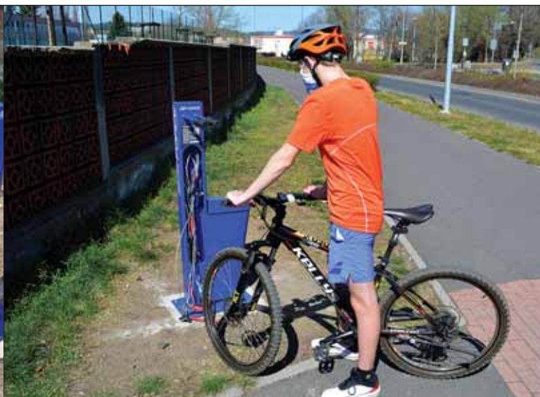
Servisní stojan technické pomoci se nachází v ulici Na Průtahu poblíž skateparku. Stojan je určený k opravě jízdního kola.